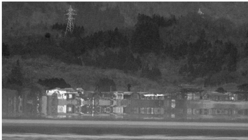
【写真 4：猪苗代湖西岸崎川浜】