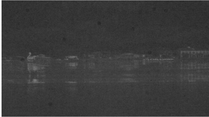
【写真 2：長浜付近の白鳥丸】