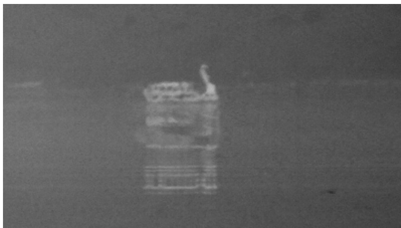
【写真1：幾層にもなっている白鳥丸】