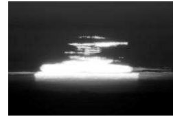
蜃気楼で ゆがんだ 南極の太陽