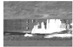
蜃気楼でたくさん浮かんで見えた雪上車

日本教育大学院大学客員教授・気象予報士・第50次南極観測越冬隊員 また、写真家として気象や天体などの写真や映像を撮影している。 著書に『世界一空が美しい大陸 南極の図鑑』『すごい空の見つけかた2』『空の写真の撮り方』など。また、日本テレビ「世界一受けたい授業」、TBSテレビ「教科書にのせたい！」などにも出演。