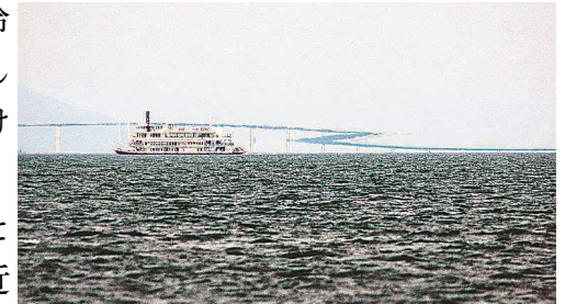
琵琶湖の上位蜃気楼（Z字型に変化した琵琶湖大橋）

2000年以降、私と市瀬和義富山大教授らの研究によって、蜃気楼の科学的研究は大きく前進しました。富山湾沿岸で、高さの異なる地点の気象観測を行うほか海上にアドバルーンを揚げて30m付近までの気温の鉛直分布を調べたり、光路計算による画像シミュレーションを行ったりしました。その結果、富