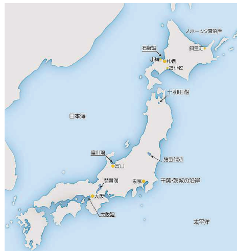
上位蜃気楼の主な発生地

日本で蜃気楼が科学的に研究されるようになったのは、大正になってからのことです。例えば、手こぎの舟に高さ3m程度