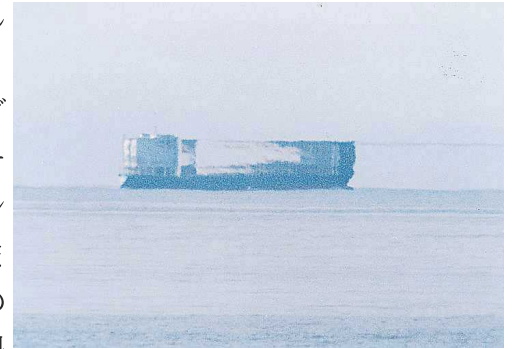
魚津から撮影した船の上位蟹気楼

同博物館の隣りに、観光施設「海の駅 蟹気楼」があります。ここには200台あまりの駐車スペースがあり、周囲が海に面した堤防であることから、蟹気楼を見る絶好の場所の一つといえます。蟹気楼のシーズン中には、魚津市から委嘱された解説員や魚津蟹気楼研究会の会員が見つけ方のポイントなどを現地で優しく教えてくれるので、初めて見に来た人でも十分に楽しむことができます。